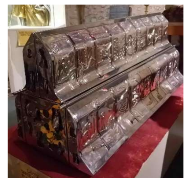
Châsse de 1982

Je m'en voudrais de ne pas évoquer le « Trou de Sainte-Gertrude » par lequel, selon la légende, ne peuvent passer que les personnes en état de grâce. Un état dont sont exclues les personnes corpulentes, étant donné l'étroitesse du passage.