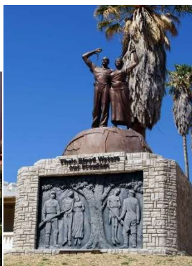
Monument aux victimes du génocide