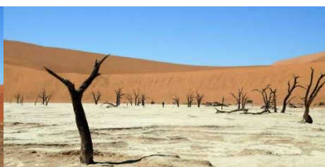
Cuvette de Dead Vlei et acacias morts