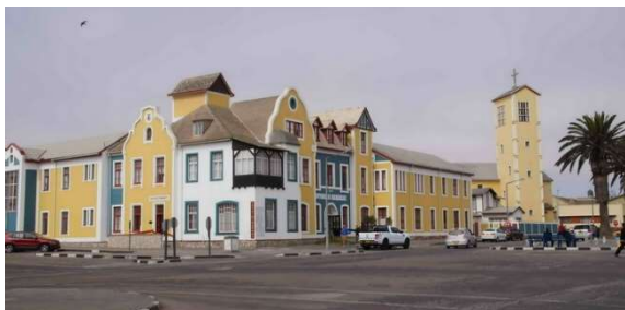
Swakopmund : quartier colonial

Nous avons été stupéfaits de constater que, dans certaines localités se dressent encore d'imposants monuments érigés par les Allemands à la gloire de leurs soldats. À Swakopmund, un de ces monuments trône fièrement au cœur d'un parc pour rendre hommage aux soldats qui ont participé aux guerres menées, entre 1904 et 1908, contre les Héréros et les Namas pour réprimer une révolte des autochtones. Ces guerres se sont soldées par un génocide dont furent victimes entre 25 et 65 000 indigènes massacrés par ces « vaillants soldats ».