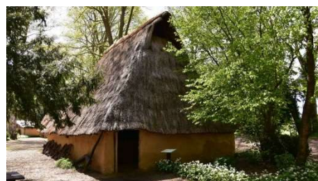
Maison de l'âge du Fer