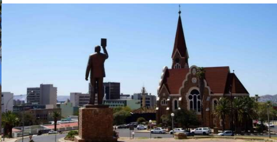
Statue du président brandissant la constitution et église luthérienne allemande

Pour terminer ce voyage, les impressionnantes chutes du Zambèze baptisées chutes Victoria, à cheval sur la frontière séparant deux pays voisins, le Zimbabwe et la Zambie, méritent quelques pas au-delà de la frontière namibienne !