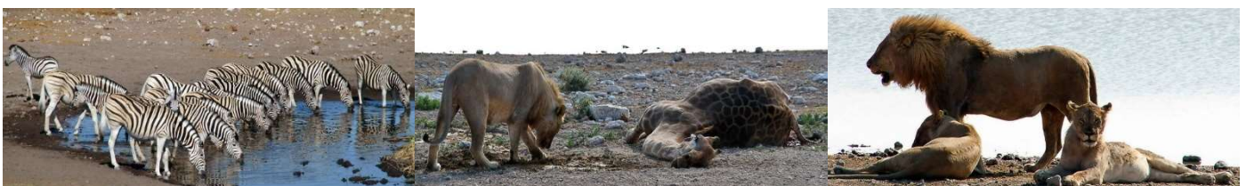
Dans le parc national d'Etosha

Le parc national d'Etosha est grand comme les deux tiers de la Belgique. Plus de 340 espèces d'oiseaux et 114 espèces de mammifères y vivent librement, à l'état sauvage. Ils ne peuvent être ni chassés, ni nourris. C'est un émerveillement continu quand on y circule dans un véhicule panoramique : on admire des centaines de zèbres, d'oryx, de springboks, d'impalas, de phacochères, d'éléphants, de gnous, de rhinocéros, de lions ... dans leur milieu naturel. On assiste à leurs passages, très hiérarchisés, famille d'animaux par famille, aux points d'eau et, quand on a de la chance (nous l'avons eue, au contraire de la malheureuse victime), on découvre un lion qui vient de tuer une girafe; il la veille consciencieusement des heures durant sous le soleil pour éviter que sa dépouille soit entamée par des rivaux ou des vautours ... et le lendemain on assiste au plantureux banquet réunissant toute une fierté de 11 lions et lionnes !