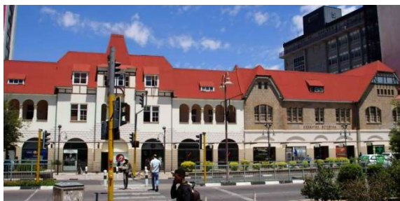
Windhoek : en ville

Windhoek (le coin venteux en afrikaans) est une très jolie capitale, au cœur du pays. Une ville très verte aisément visitable à pied. Mais entre parcs, parlement, gare, complexes commerciaux, ..., on découvre que certaines sinistres séquelles de l'apartheid sudafricain subsistent sournoisement. Certains quartiers de la périphérie sont réservés aux Blancs. Les Noirs ne peuvent y circuler que pour y travailler et, après 18 h, ils doivent avoir un sauf-conduit de leur patron pour y accéder. Toutes les maisons sont protégées par des clôtures généralement électrifiées et ces quartiers sont surveillés, non pas par la police, mais par des gardes privés armés de fusils !