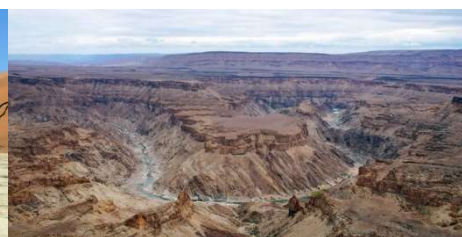
Fish River Canyon

Dans le désert du Kalahari, à l'est, le plateau est découpé par le Fish River Canyon. Avec ses 160 km de longueur, c'est un des plus grands canyons du monde (après le canyon du Yarlung Tsangpo, en Chine, et le Grand Canyon du Colorado en Arizona). Sa vallée atteint une largeur maximale de 27 kilomètres et une profondeur de 550 m. Très pittoresque, il a été creusé par la Fish River, une rivière intérieure pratiquement à sec en dehors de la saison des pluies.