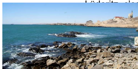
Lüderitz : la baie

La capitale Windhoek était dominée par un imposant et conquérant cavalier allemand. Depuis quelques années, le fier destrier et son officier ont été rentrés à l'écurie. En fait ils sont remisés dans un musée tout proche et remplacés par la statue du premier président de la Namibie indépendante, Sam NUJOMA, brandissant fièrement la constitution du jeune pays. De plus, à proximité, on a dressé un monument en l'honneur des Héréros et Namas victimes du génocide.