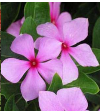
Pervenche de Madagascar